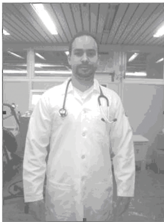
Figura 6. Moderna