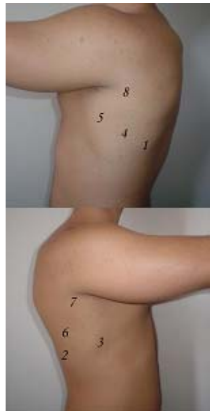
Figura 3 e 4. Sítios de ausculta pulmonar das faces laterais do tórax

É importante que o exame seja sistematizado a fim de se auscultar todos os lobos nos respectivos campos pulmonares, simétrica e comparativamente. Orienta-se iniciar pelas bases porque várias tomadas e inspirações poderiam alterar eventuais ruídos adventícios motivados pela reexpansão pulmonar. As Figuras 2, 3 e 4 ilustram os sítios de ausculta pulmonar. Na ausculta das faces laterais do tórax, é interessante solicitar a flexão do ombro para melhor acesso.