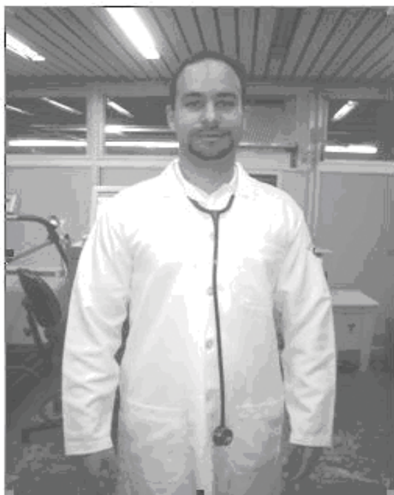
Figura 5. Tradicional

média de um profissional é de 75 dólares 15 . Chegou-se ao número de 20.5 milhões de dólares “jogados fora” com o tempo de tirar o aparelho de pescoço e auscultar o paciente 15 .